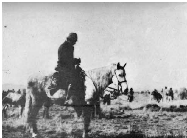
A caballo en el campo.

piedad en Lacalaca (cerca de Sapahaqui) y comenzar a liquidar sus asuntos pendientes. Pero antes había ocurrido algo que cobró mucha importancia en lo que hizo el resto de su vida: en septiembre de 1926 se suicida Armando Chirveches en París. La noticia se la da Costa du Rels y los pormenores de la impresión que vivió ante este hecho Arguedas los consigna en la segunda entrada del primer tomo de La danza de las sombras . Señala cómo