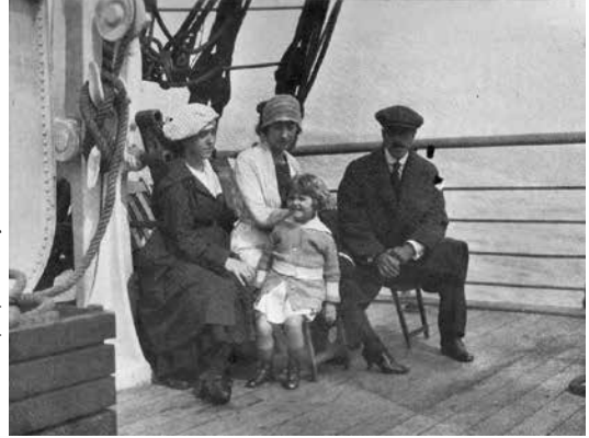
Hacia Europa por mar y con la familia.

En una entrada incluida en el segundo tomo comenta que recibe en Francia un libro de éste. Por el año de la entrada, 1931, debió ser Wall Street y hambre , que Marof había escrito después de su estada ese año en Estados Unidos 19 , y le da ocasión para hacer una suerte de relato destructivo del prontuario revolucionario inicial de Marof desde un episodio de trapacería